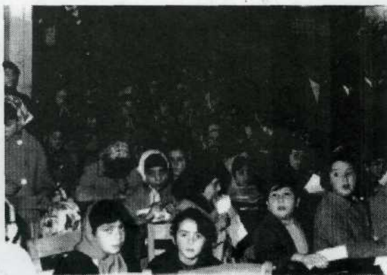
I fedeli venerano la Madmna