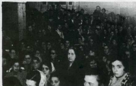
1960 - I fedeli venerano la Madonna