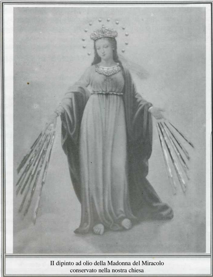
Il dipinto ad olio della Madonna del Miracolo conservato nella nostra chiesa